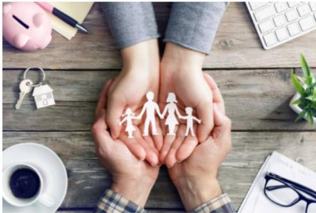
Insurance: Representational Image

PolicyX.com claimed that the insurance price index uses concepts of indexing and basic statistics.